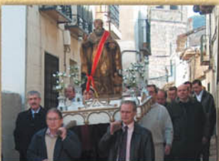
Fiesta de San Antón.

San Antón y San Sebastián , en enero; San Blas y Santa Águeda , en febrero; el Santo Ángel de la Guarda, en marzo; la particular Feria de Abril, en mayo; San Isidro, las verbenas de San Cristóbal y Santa Marta, en julio y la Fiesta del Pilar completan el calendario festivo de interés.