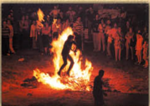
Hoguera de San Juan.