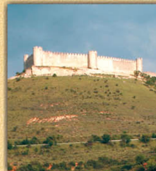
Castillo del Cid.

Desde hace 13 siglos, el Castillo del Cid corona el "cerro más perfecto del mundo" y ofrece una panorámica única del valle del Henares y la Campiña de Guadalajara. Uno de los pocos de planta rectangular, fue residencia militar y palaciega y todavía hoy objeto de unas tareas de restauración que se iniciaron en 1961. La Fábrica Nacional de Moneda y Timbre acuñó en 2001 el sello propio del Castillo de Jadraque.