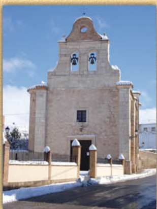
Ermita del Cristo y La Soledad.