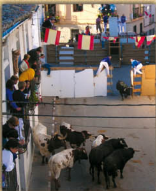
Desencajonamiento de reses.

La tradición taurina se remonta en la memoria con encierros por el campo y por las calles, engalanados con el colorido de las peñas y música de charanga durante las Fiestas Patronales del 13 al 18 de septiembre .