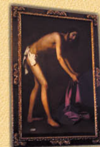
Lienzo de Zurbarán.

La solemne Iglesia de San Juan Bautista , fechada en el siglo XVI, deslumbra por su retablo barroco, una antigua rejería en la zona del altar mayor y tres amplias naves coronadas por una enorme cúpula semiesférica. En el templo se pueden visitar el Cristo de los Milagros, una talla atribuida a Pedro de Mena, y el lienzo de Francisco de Zurbarán "Cristo recogiendo las vestiduras".