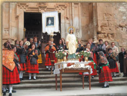
Festividad de Santa Águeda.

Noche de San Juan. Cena Medieval en el Castillo del Cid. La festividad de San Juan es otra de las citas festivas de interés a lo largo del año. Una noche mágica que culmina con una cena popular, al más puro estilo medieval, con menú y trajes de época, arropada por los muros del Castillo. Los más osados saltan las Hogueras de San Juan para que se cumplan sus deseos y el fuego queme los malos augurios.