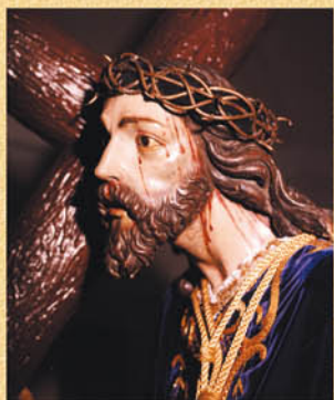
Cristo de la Cruz A Cuestas.