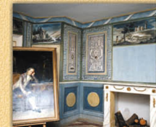
Saleta de Jovellanos.