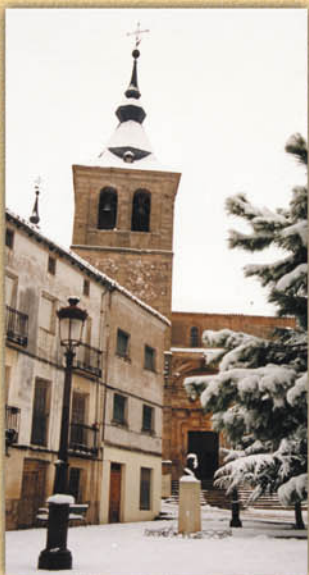
Plaza de Gutiérrez de Luna.